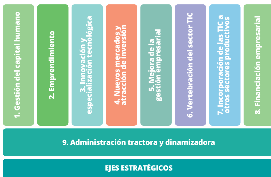
Figura 4.1: Ejes estratégicos de la EISTIC

El conjunto de ejes estratégicos se recogen en la figura adjunta, siendo la finalidad de cada uno de ellos la que se indica a continuación: