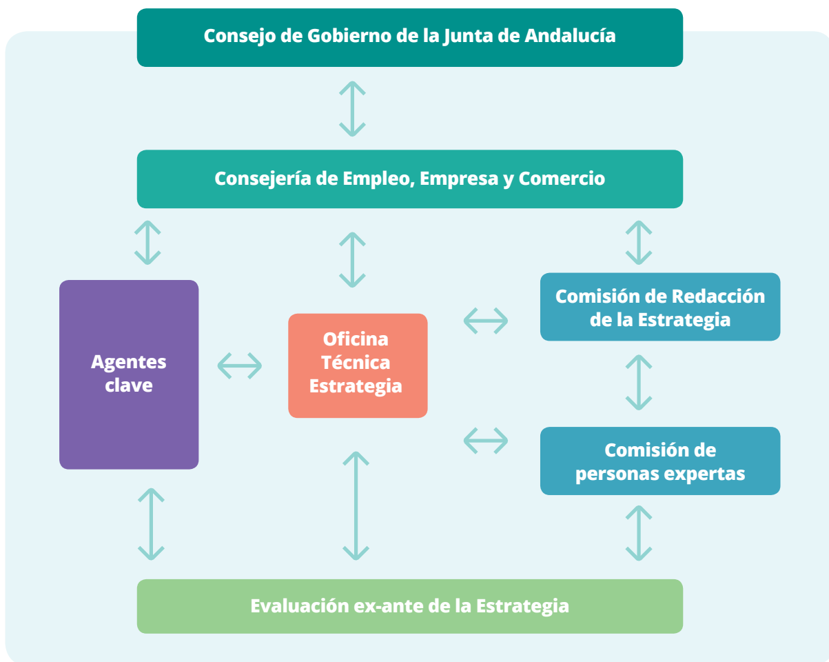
Figura 2.1: Estructura del sistema de gobernanza de la formulación de la Estrategia de Impulso del Sector TIC Andalucía 2020